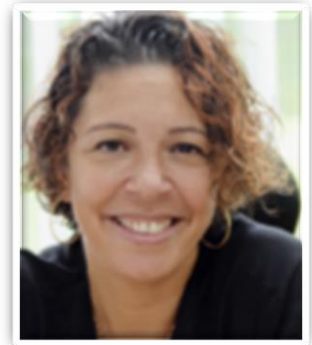
Présidente de l'association AGK2S

L'indicateur formation déjà présent dans le bilan standardisé devrait ainsi progresser et attester de l'investissement de chaque structure et professionnels dans les 3 secteurs : sanitaire, médicosocial, libéral.